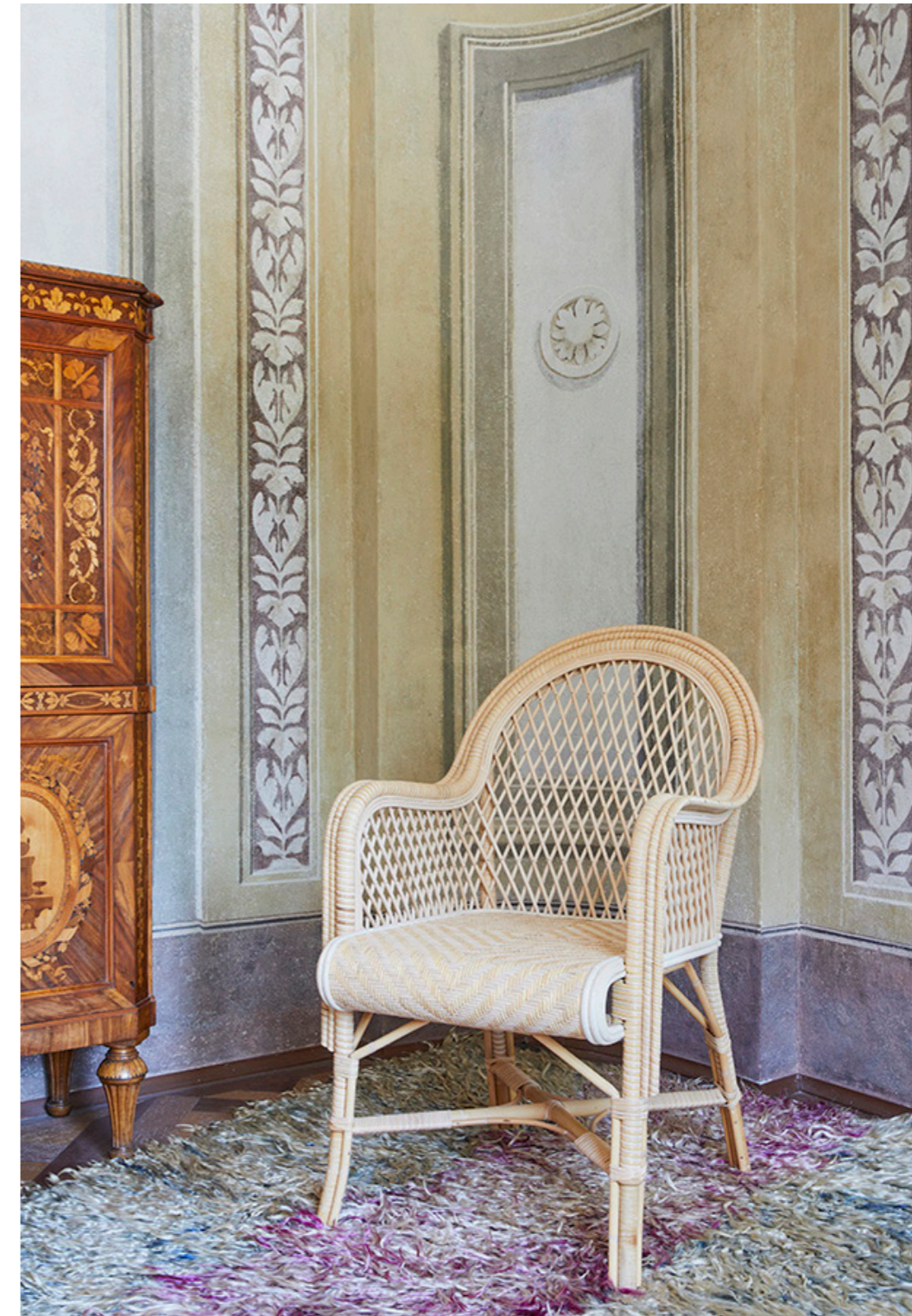
Starring Poltroncina da pranzo Brando Bi color Design di Mario Bonacina e Renzo Mongiardino

con Tappeto Altai Filikli Anatolia - Karapinar Inizi XX secolo Lana d'Angora